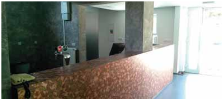
Bar v Dětském ráji