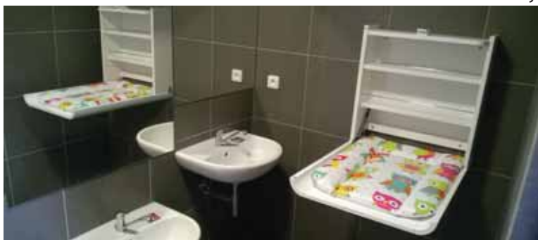
Toalety v Dětském ráji