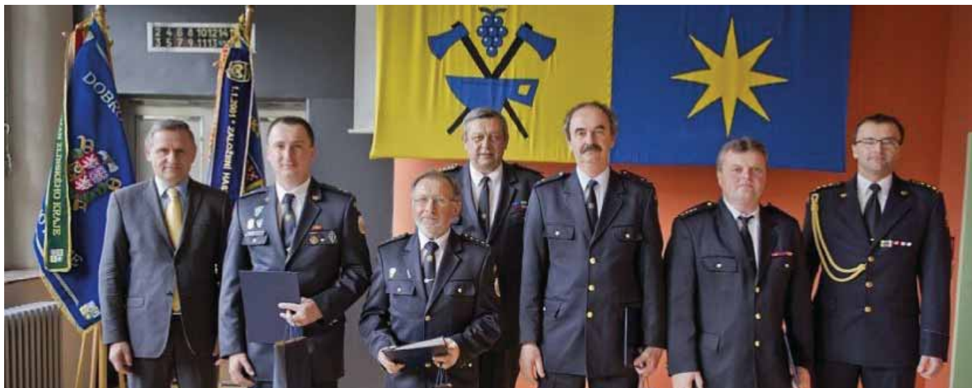
Hejtman Zlínského kraje, Jiří Čunek, ocenil dne 5.5. 2017 v sídle Zlínského kraje práci dobrovolných i profesionálních hasičů.