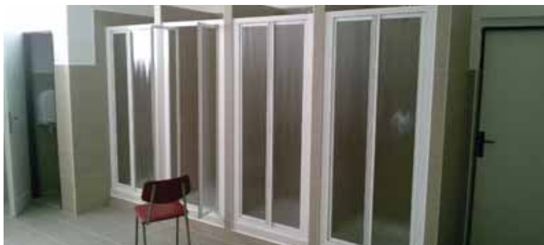
Sprchy - Administrativní budova Biskupice