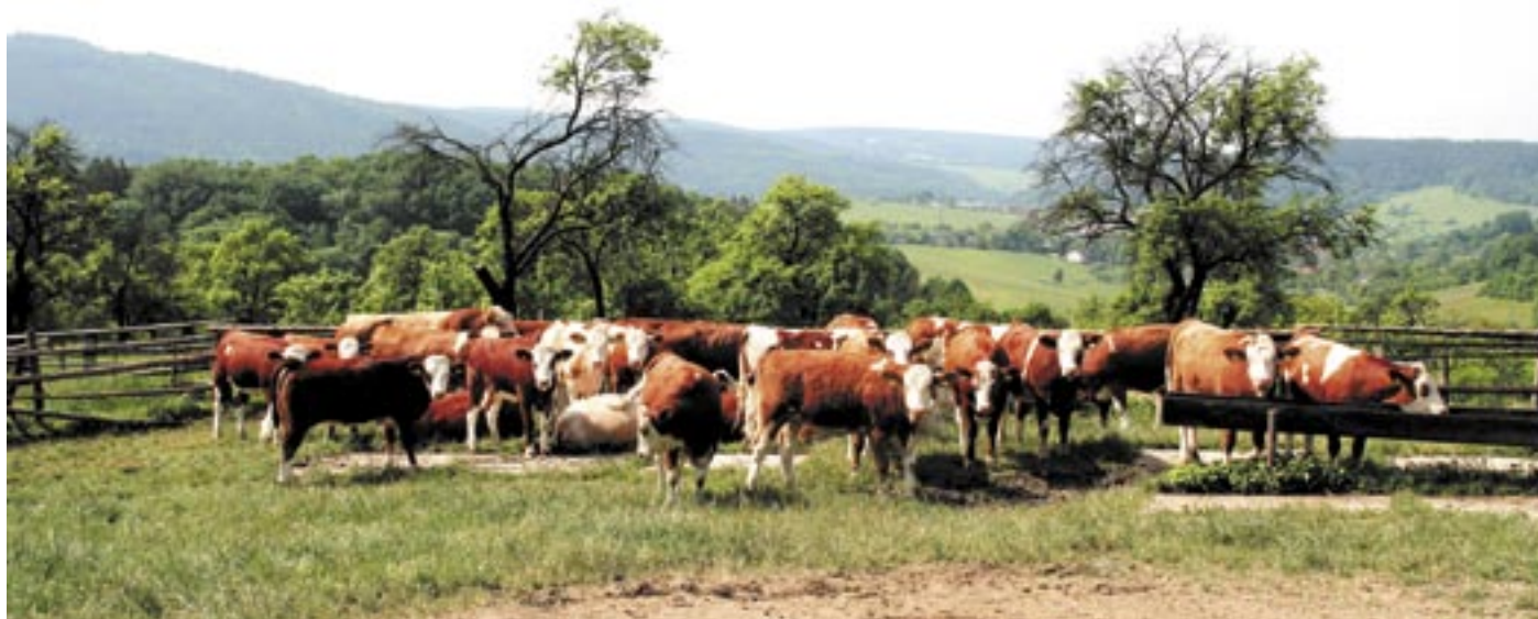
Stádo jalovic na pastvině na Podhradském vrchu.

lázeňství. „Jsme zařazení do systému ekologického hospodaření,“ vysvětluje ředitel Svízela, „a to je systém, pro který platí velmi přísná pravidla Evropské unie. Proto při jakékoli produkci nepoužíváme žádné chemické látky, ať už jde o hnojiva, pesticidy nebo syntetické vitamíny a hormony. Proto můžeme veškeré naše produkty, jak rostlinné nebo živočišné, certifikovat jako BIO produkty.“ Ocení to návštěvník příjemné krajiny okolí Luhačovic? „Jsem přesvědčen, že o tom ví jen málokdo. To spíš my se setkáváme s důsledky vpádu