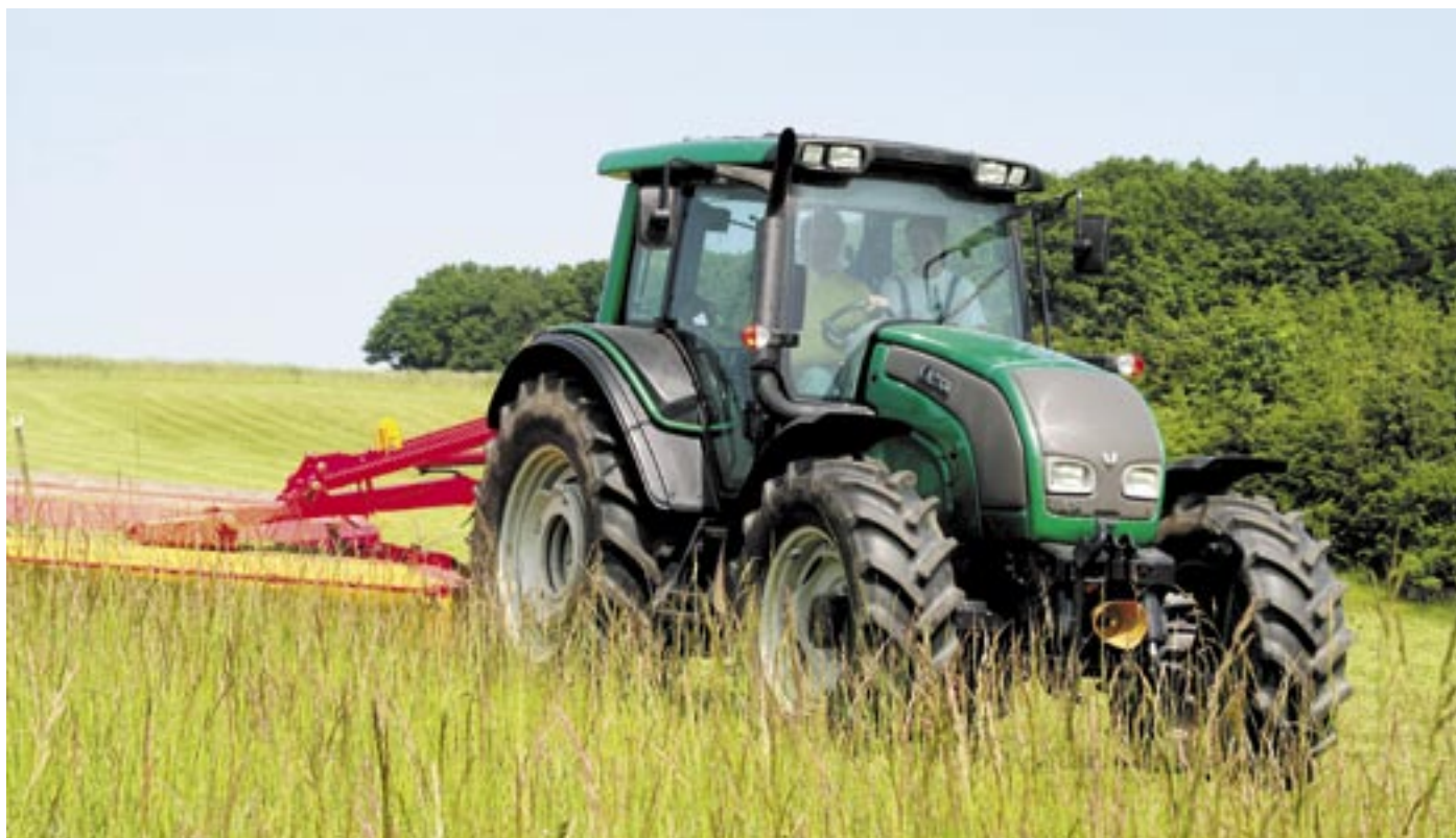
Součástí kvalitního krmiva je seno z okolních proslulých luk. Na snímku posádka traktoru - Stanislav Zápeca a Tomáš Vacula.

turistů na naše louky a pastviny. Každou chvíli najdeme otevřené brány v oplocení. Dobytek se pak pochopitelně dostává i tam, kde není vítán a způsobí škodu. Ohlídat všech ploty ovšem v našich silách není, jen ohrad je na 170 kilometrů, “ doplňuje Aleš Svízela.