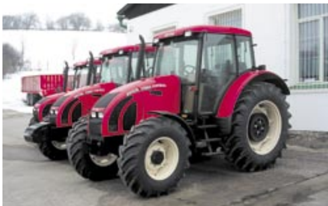
Traktory Zetor patří ke světové špičce ve své oblasti.

plán s výrobou více než dvojnásobného počtu traktorů ročně.