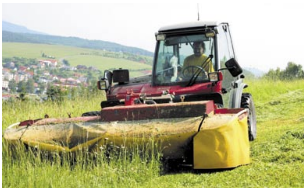
Josef Dynka při sečení travního porostu na seno.