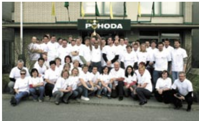
Hotel Pohoda byl svědkem slavnostního vyhlášení výsledků turnaje v bowlingu.